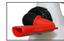
Einfüllstutzen auch für kleinste Tanks. Mit Abflachung zur Einsicht und gute Entlüftung beim Tanken.