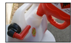
Grosse Einfüllöffnung für einfaches Befüllen